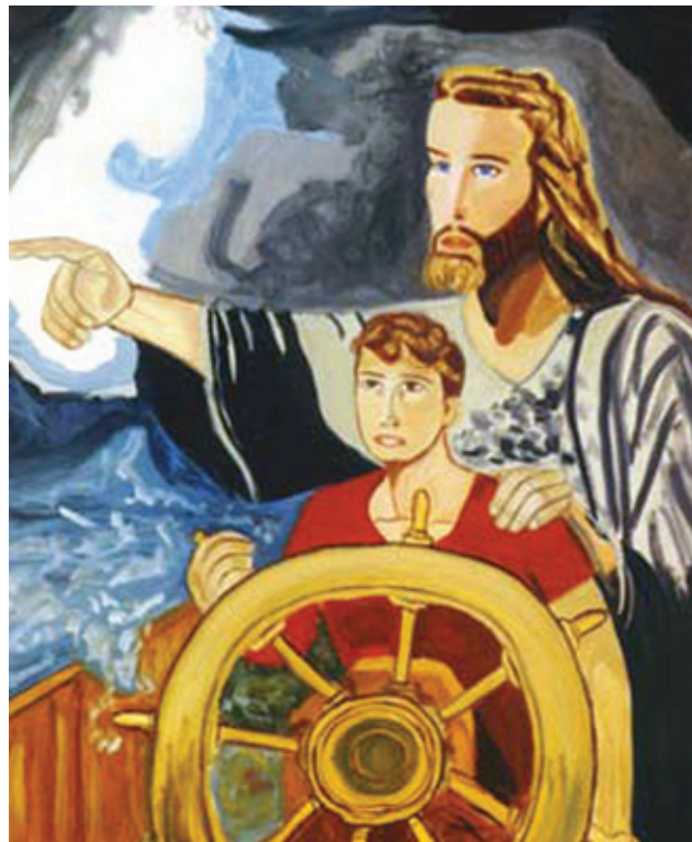
„Господ Исус Христос показва пътя“, худ. Роза Моисовска, Македония