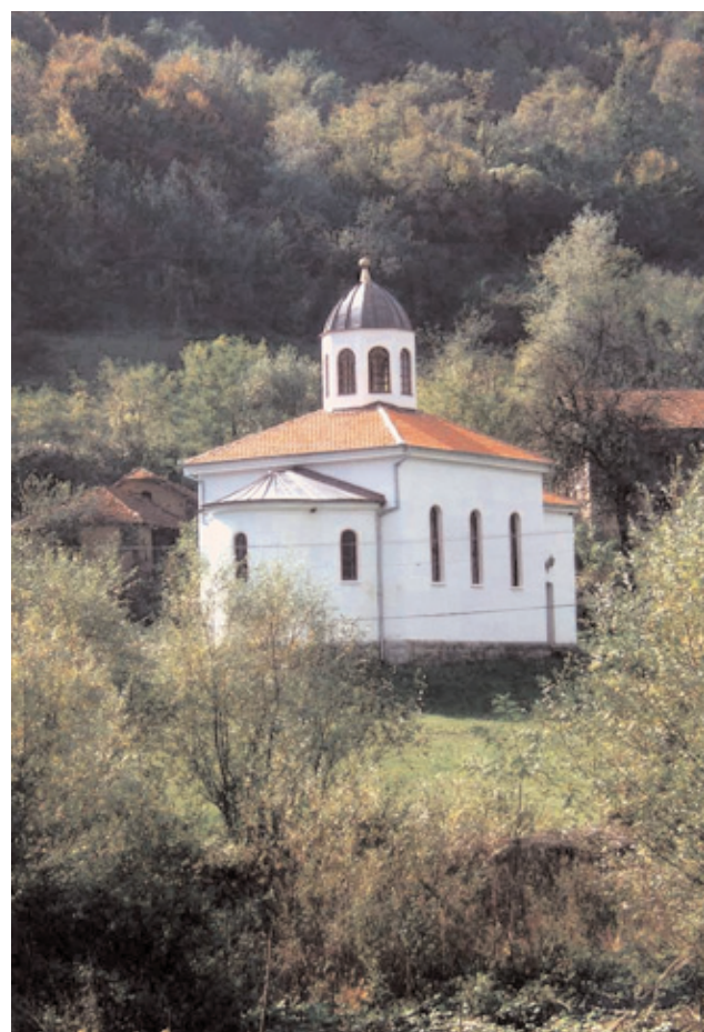
Църквата Св. Илия в с. Звонци