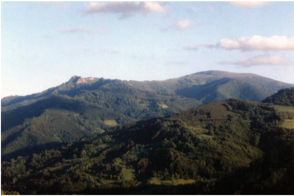
Поглед към Руй планина и родното място на поета - с. Вълчигол