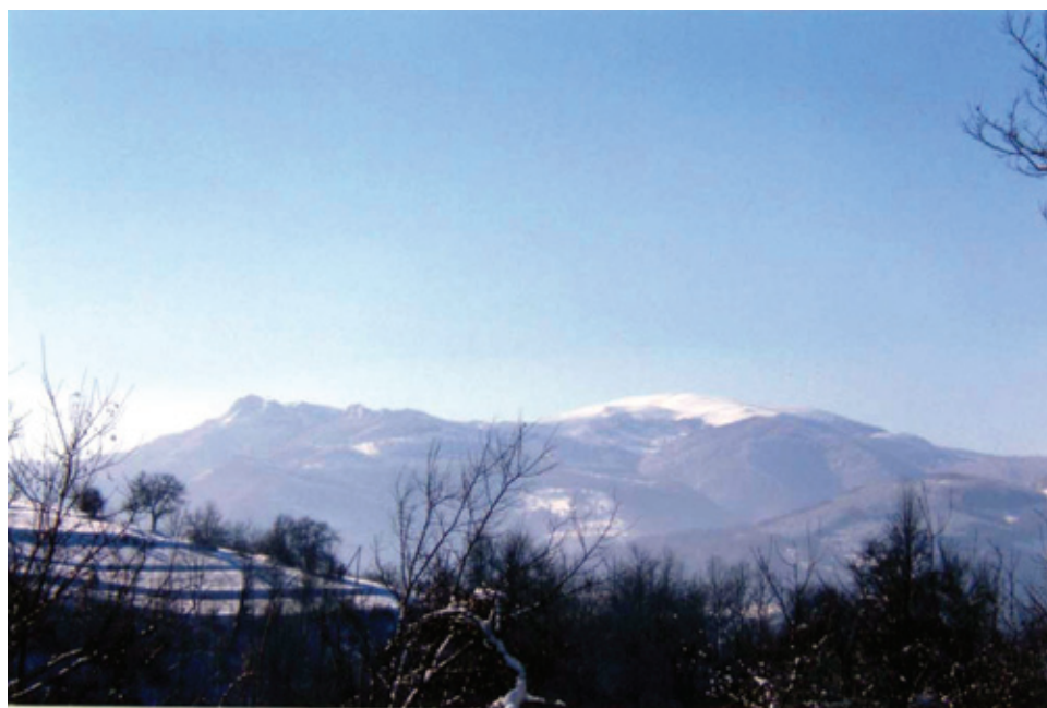
Зимен пейзаж от Руї планина

- Да! - чух женски глас, смътно познат - дрезгав, изненадан и, стори ми се, уплашен.