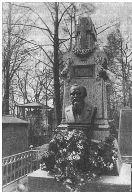
Гробът на Достоевски

"Знаех, че ми остава да живея само 5 минути. Но тези минути ми се виждаха години, сякаш толкова дълго щях да живея. Вече ни обличаха ризите на смъртните и ни разделяха по трима, аз бях осми в третата редица. Първите трима вързаха за стълбовете. След 2-3 минути двете редици щяха да