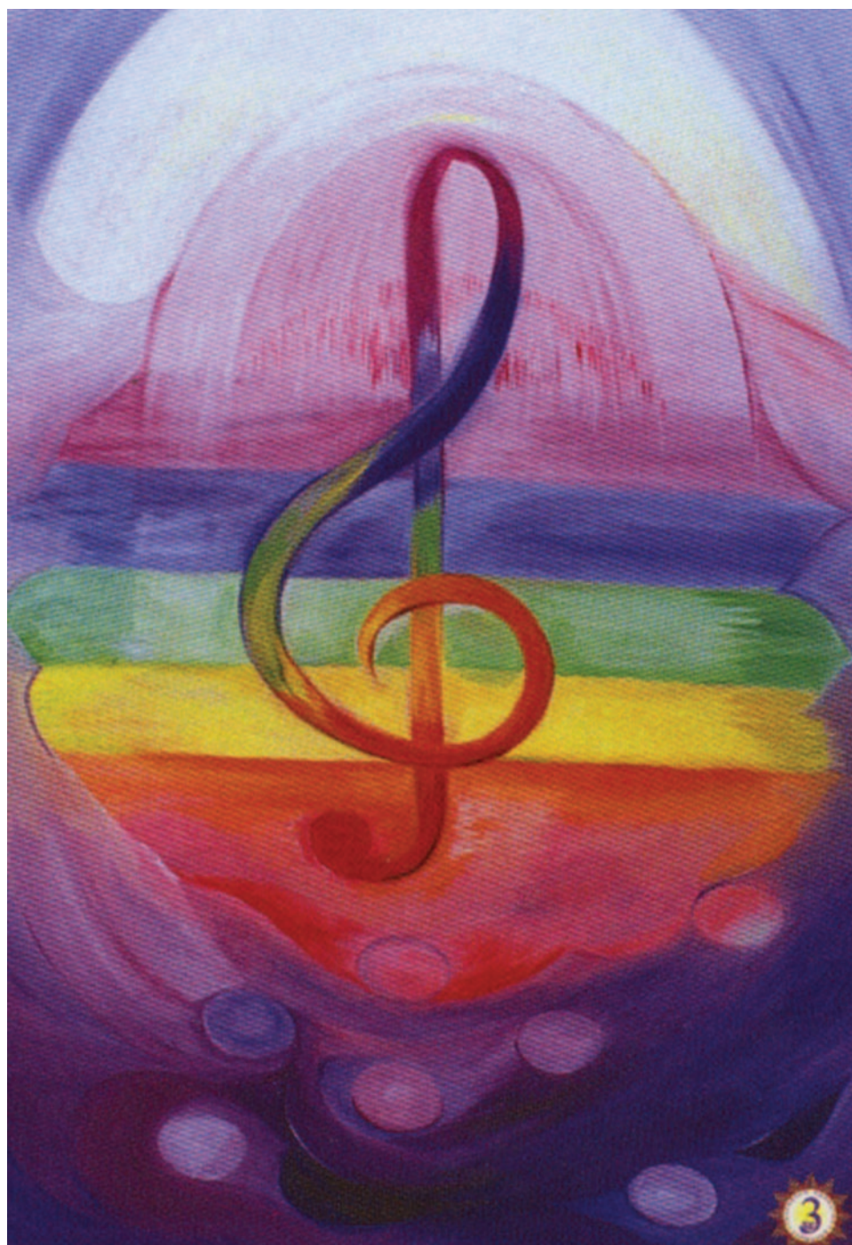
худ. Добринка Златарева, Смолян