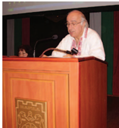
Акад. Христо Маджаров

ДА СПАСИМ СВЕЩЕНИТЕ КОРЕНИ - акад. Христо Маджаров