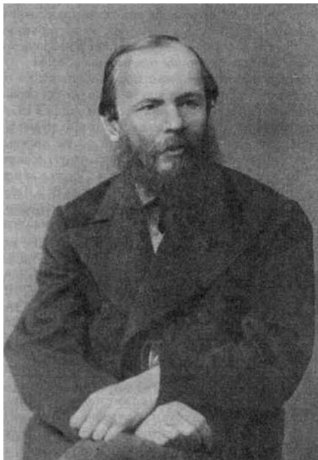
Ф. М. Достоевски (1821-1881)

гарска църква открили двеста посечени трупа."